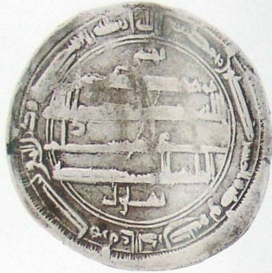
درهم عباسي هارون الرشيد ضرب: الحمديّة سنة: ١٧٣ هجري Abbasids Dirham Haroon Al-Rasheed struck at Al-Mohammedeya Year: 173 H